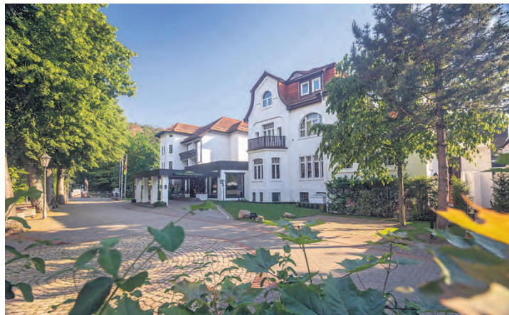
Im Mühl Vital Resort werden sich unsere Gewinner herrlich entspannen.

Das in dritter Generation geführte Mühl Vital Resort liegt direkt am Kurpark von Bad Lauterberg. Das Hotel mit seinen im Landhausstil eingerichteten großzügigen Zimmern und Suiten verfügt über einen 1.800 Quadratmeter großen Wellness-Bereich. In der Sauna- und Badelandschaft mit Serail-, Pharaonen- und Aromabad, Erlebnisduche, Dampfbad, Hamamliege und Beauty-Center lässt es sich herrlich entspannen. Kneippanwendungen, Thalasso, Massagen und Shiatsu gehören ebenso zum Programm wie Beautykuren und exklusive Gesicht- und Ganzkörper-Anwendungen. Auch kulinarisch wird den